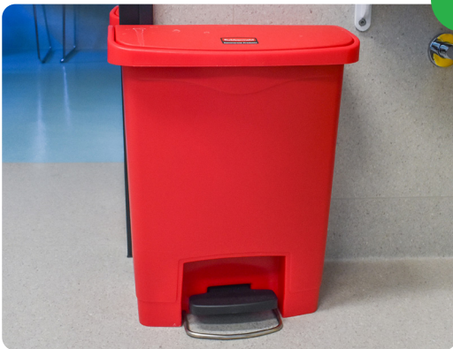
تخلص من الشرائط وأعد تعبئة العداد

المنتج من: طب مرض السكري والغدد الصماء. المرجع: © CAHS 2023 1630 يمكن توفير هذه الوثيقة بأشكال بديلة بناءً على طلب شخص من ذوي الإعاقة. إخلاء المسؤولية: هذا المنشور مُخصص لأغراض التعليم العام والمعلومات. اتصل بأخصائي رعاية صحية مؤهل من أجل الحصول على أي نصيحة طبية تحتاجها. © ولاية غرب أستراليا، خدمة صحة الأطفال والمراهقين.