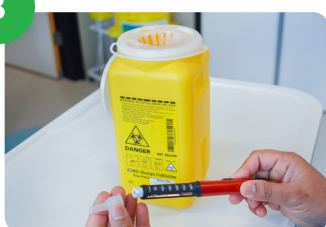
将盖子盖在针上并拧下来。 将针头等尖锐物扔进 垃圾桶。