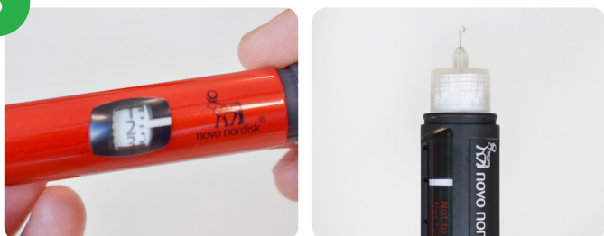
拨到2个单位并丢弃胰岛素